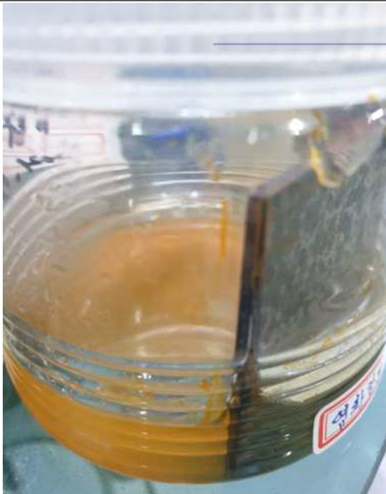
시판용 염화칼슘 강제 부식성