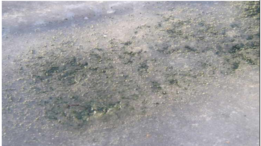
< 에코트랙션이 얼음을 녹이는 모습 >

'에코트랙션(Eco Traction)'은 캐나다 토론토에서 개발된 것으로 광물질로 이뤄진 제설제로 태양열로 온도를 높여 눈을 녹이는 방식으로 도로를 부식시키거나 식물에 유해하지 않은 특징이 있음