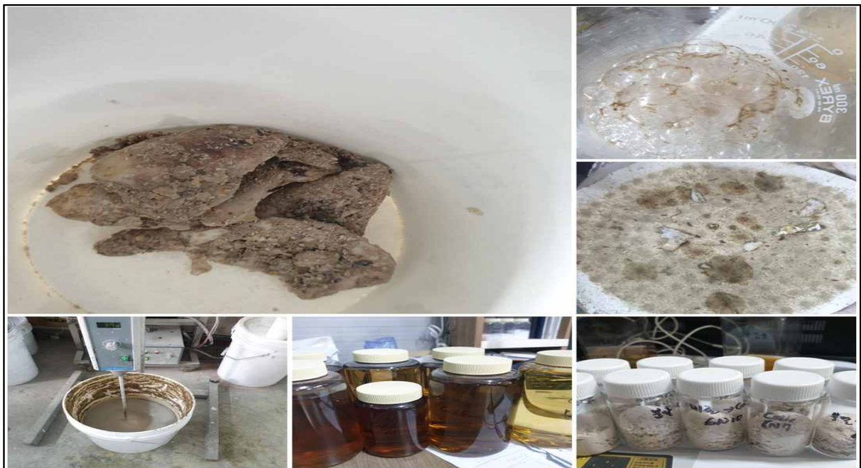
< 패각분말을 활용한 염화칼슘의 제조 >

(3) 친환경 제설제는 패각(대표적으로 굴껍질)을 이용하여 염화칼슘 제조함으로 버려지고 방치되는 굴껍질을 자원화하고, 획기적인 기술로 부식방지효과를 갖는 성분과 상호작용 매커니즘을 통해 부식억제력을 개선시킨 친환경 제품임